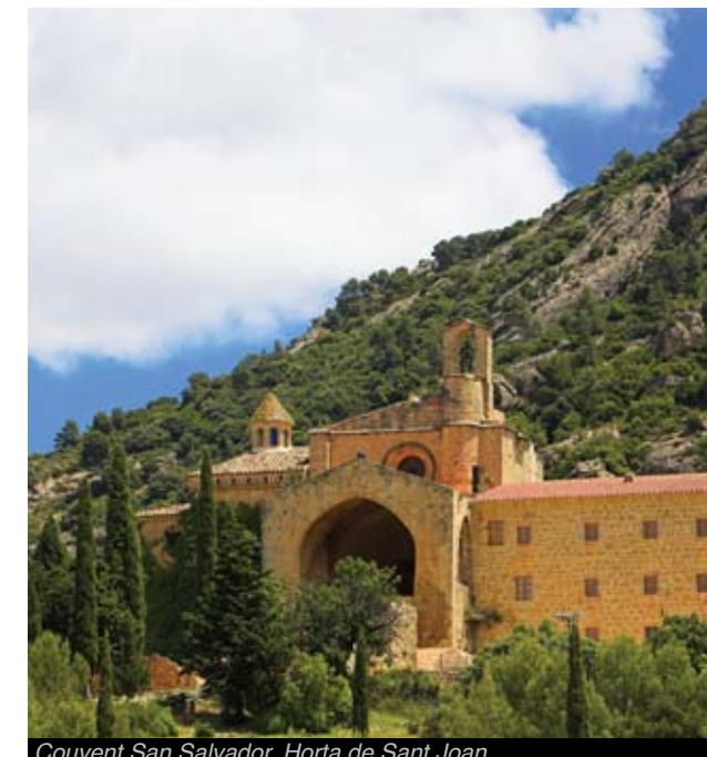
Couvent San Salvador, Horta de Sant Joan

Mais l'une des personnalités les plus célèbres liées à ce territoire est-elle, sans aucun doute, le peintre Pablo Picasso . Ses brefs mais intenses séjours à Horta de Sant Joan, en Terra Alta ont en effet marqué le début du cubisme et ont donné lieu à un avant et un après dans le développement des avant-gardes picturales du XXe siècle.