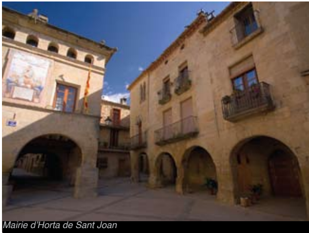
Mairie d'Horta de Sant Joan