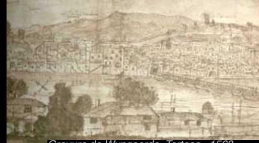
Gravure de Wyngaerde. Tortosa, 1563.