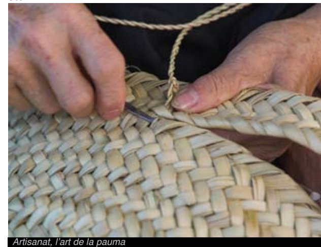
Artisanat, l'art de la pauma

De nombreux villages ont conservé la vieille tradition artisanale de la vannerie. La pauma , en Terres de l'Ebre, a été initialement récupérée par les ateliers de vannerie de Mas de Barberans mais aussi par ceux d' Els Reguers , de Rasquera , de Paüls , de Pinell de Brai ou d' Alfara de Carles . Dans tous ces villages en effet, il est donné de voir comment marier artisanat et design. Le petit palmier, seule espèce de palmier autochtone d'Europe et intimement lié, en tant que matériau à la terre et à la tradition des Terres de l'Ebre, bien qu'abandonné dans les années 50, est actuellement récupéré et à nouveau utilisé dans le travail de la pauma: La séparation des fibres, le trempage, le tressage, etc.