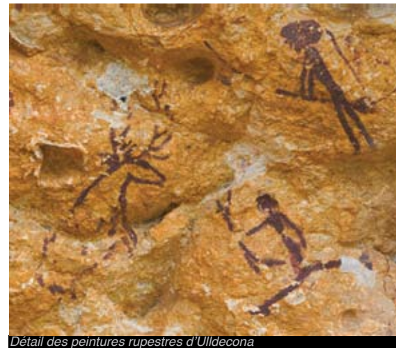
Détail des peintures rupestres d'Uildecona

Découvrez toute la symbolique des figures humaines et animales des vestiges de l'art rupestre des Terres de l'Ebre, déclarés Patrimoine de l'Humanité