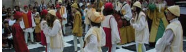
Petits et grands au rendez-vous de l'Échiquier vivant

Móra d'Ebre revit son passé sous domination arabe, une période lors de laquelle vivaient en bonne entente, musulmans, juifs et chrétiens. Le temps d'un week-end de la première quinzaine de juillet, bouffons et gastronomie arabe déploient leur imagination, le marché artisanal présente ses vieux métiers où se retrouvent forgerons, fileuses, boulangers et tailleurs de pierre tandis que les spectacles de musique, de danse et de théâtre se succèdent pour que Móra redevienne Maure, brandissant haut de nouveau, et le temps d'un week-end seulement, sa croix et son croissant de lune.