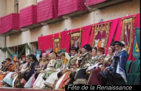
Fête de la Renaissance