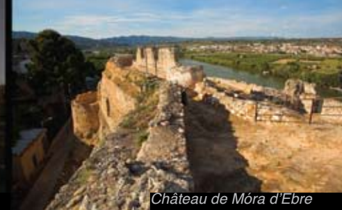
Château de Móra d'Ebre