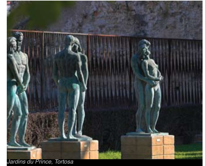
Jardins du Prince, Tortosa

Dans les jardins qui s'étendent du Château de la Suda au Fortin de Tenasses, en longeant la muraille édifiée par la ville au XIVe siècle, promenez-vous au cœur d'une exposition permanente en plein air et laissez-vous séduire par les œuvres du sculpteur Santiago de Santiago.