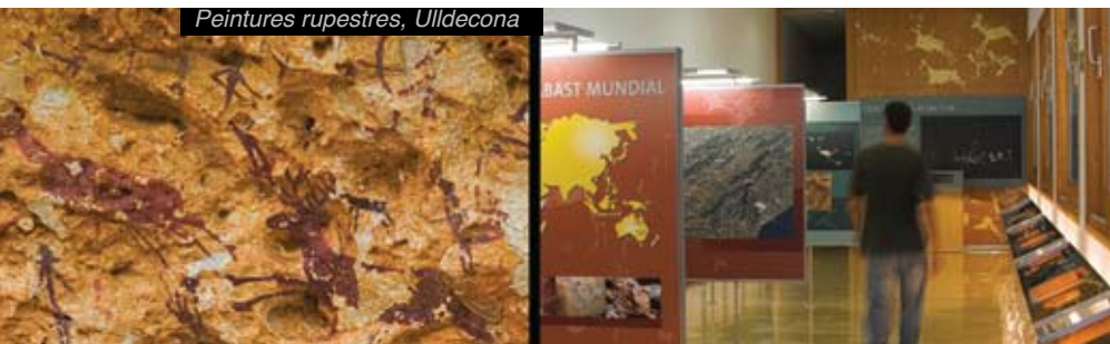
Peintures rupestres, Uildecona

> Les ibères de la Vallée de l'Ebre s'appelaient les ilercavons et recherchaient des lieux stratégiques où s'installer.