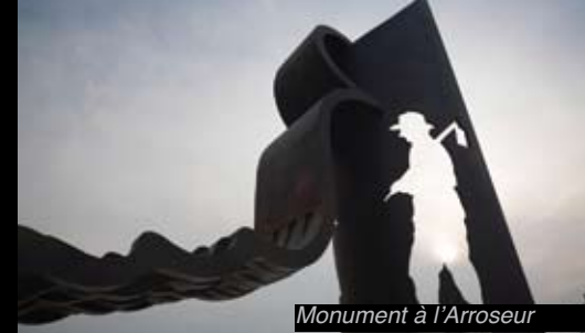
Monument à l'Arroseur