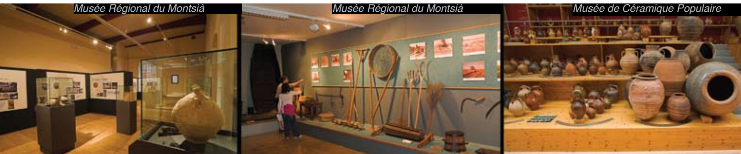
Musée de Céramique Populaire