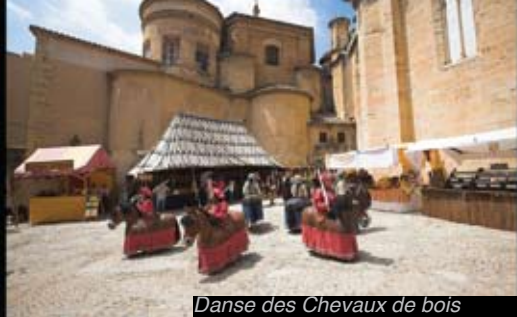
Danse des Chevaux de bois