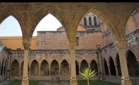
Cloître du Couvent de Sant Salvador