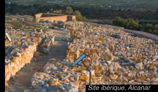
Site ibérique, Alcanar