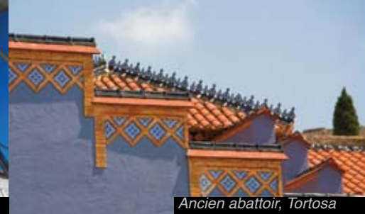
Ancien abattoir, Tortosa