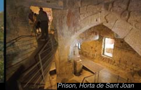
Prison, Horta de Sant Joan

Les Terres de l'Ebre fourmillent de quartiers d'une grande beauté, c'est par exemple le cas des quartiers médiévaux de Batea, d'Arnes, de Horta ou de Tivissa, ou encore des quartiers arabes, tels que, entre autres, le vieux centre de Miravet.