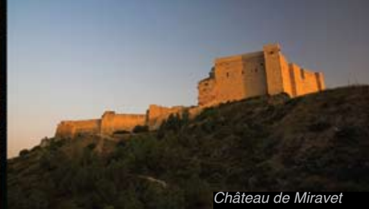
Château de Miravet