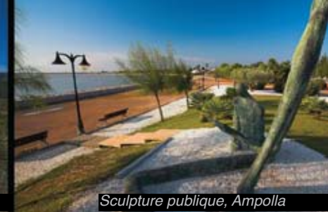
Sculpture publique, Ampolla