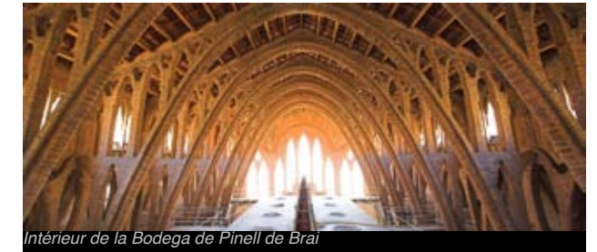
Intérieur de la Bodega de Pinell de Brai

La Bodega cooperativa de Pinell de Brai, connue comme "La Cathédrale du Vin" est un chef-d'œuvre que l'on doit à l'architecte Cèsar Martinell i Brunet, disciple de Gaudí. Du style propre au noucentisme, elle se distingue par sa façade ornée de céramiques peintes et par son jeu d'arcades intérieures ouvragées, en briques.