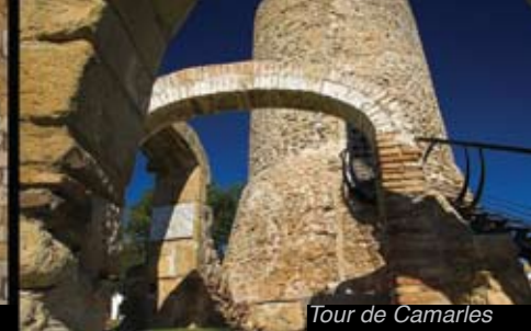
Tour de Camarles

Sur les Terres de l'Ebre, laissez-vous inspirer en visitant les plus de vingt châteaux jalonnant le territoire. Parmi ces derniers -se distinguant qui de par son emplacement stratégique, qui de par sa histoire largement documentée, qui de par sa grandeur ou de par sa récente rénovation ou encore son excellent état de conservation -ne manquez pas de visiter celui de la Suda, à Tortosa, celui de Miravet, celui d'Ulldecona et celui de Móra d'Ebre.