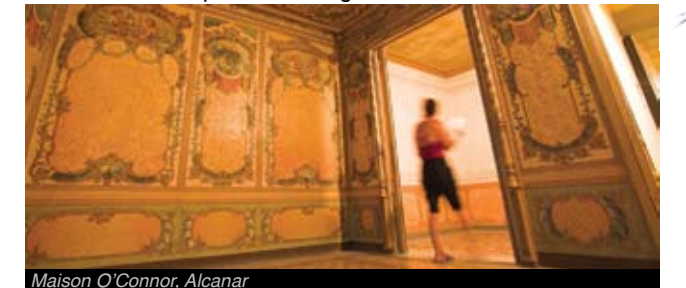
Maison O'Connor, Alcanar

En 1912, on y a découvert un ensemble constitué de boucles d'oreilles, de bracelets, de bagues, de manches de miroir et d'un petit trésor de vingt-neuf pièces de monnaie. Mais ce n'est qu'en 1927 que se produisit cependant la plus importante découverte: Celle de celui que l'on appelle le Trésor de Tivissa , qui, constitué d'un ensemble de pièces religieuses, est tout à fait unique en Catalogne.