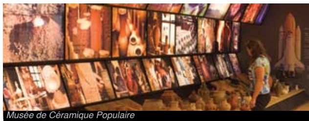
Musée de Céramique Populaire

Dans ce même musée vous serez également proposés des services touristiques complets ainsi que de magnifiques itinéraires regorgeant de savoirs divers.