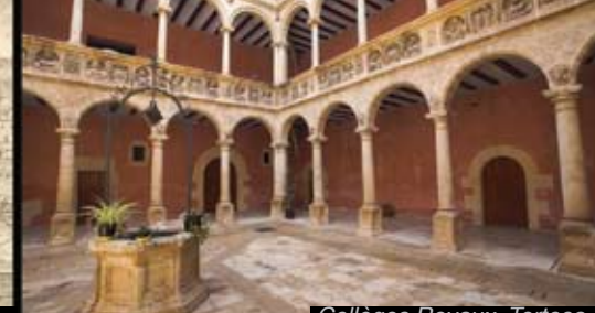
Collèges Royaux, Tortosa