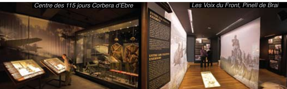
Les Voix du Front, Pinell de Brai