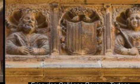
Frise des Collèges Royaux, Tortosa

> Cathédrale Santa Maria de Tortosa. La cathédrale romane, aujourd'hui disparue, se dressait autrefois au même endroit que l'enceinte actuelle. La construction de la cathédrale gothique a commencé au XIVe siècle et s'est poursuivie jusqu'à la première moitié du XVIIIe