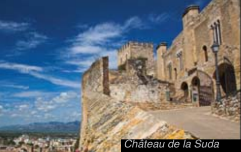
Château de la Suda