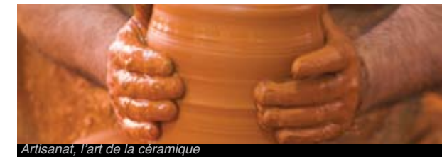
Artisanat, l'art de la céramique

En Miravet, Tivenys et la Galera l'on fabrique des objets en céramique. La production de céramique est une activité artisanale d'origine ibérique et musulmane très enracinée dans certains villages des Terres de l'Ebre, tels que Miravet , en Ribera d'Ebre, Tivenys dans le Baix Ebre, ou encore La Galera , dans le Montsià. L'on y fabrique des brocs, des cruches, des cuvettes, des jarres ainsi que des ustensiles