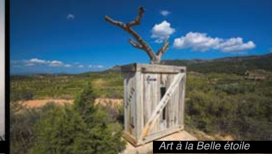
Art à la Belle étoile