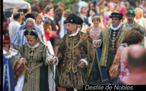
Desfile de Nobles