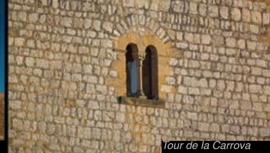
Tour de la Carrova